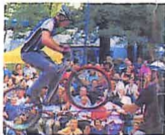
Allgäuer Festwoche, Kempten www.festwoche.com