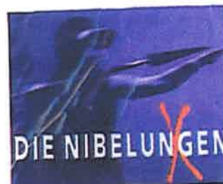
Nibelungen-Festspiele, Worms www.nibelungenfestspiele.de