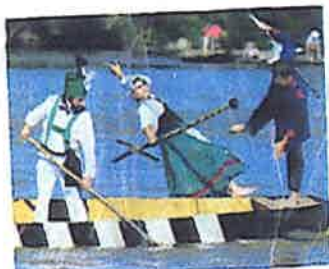
Ulmer Fischerstechen www.1150jahro.ulm.do