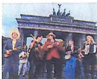
Fête de la Musique, Berlin www.fetedelamusique.de