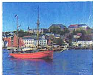
Rum-Regatta, Flensburg www.flensburg.de