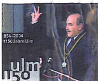
Schwörmontag, Ulm www.1150jahre.ulm.de