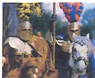
Kaltenberger Ritterturnier www.ritterturnier.de