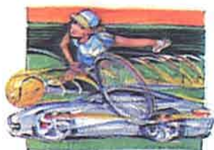
Porsche Tennis Grand Prix www.porsche.com