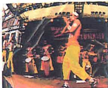
VIVA AfroBrasil (Open-Air) www.tuebingen-info.de