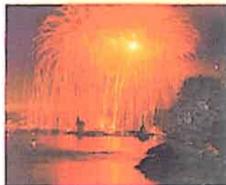
Konstanzer Seenachtfest www.seenachtfest.com