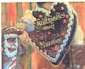
Christkindlesmarkt, Nürnberg www.christkindlesmarkt.de