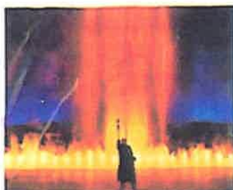
Wagnerfestspiele, Bayreuth www.bayreuther-festspiele.de