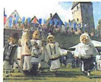
Int. Donaifest, Ulm/Neu-Ulm www.1150jahre.ulm.de