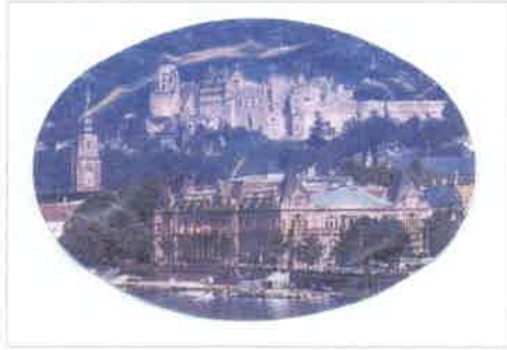
Neckarufer mit Schloss