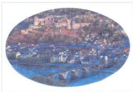
Neckarbrücke und Schloss