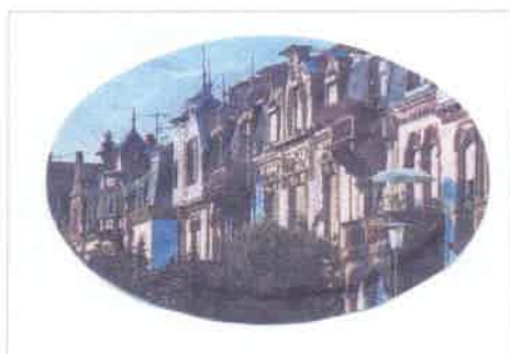
Altstadt – Gässchen