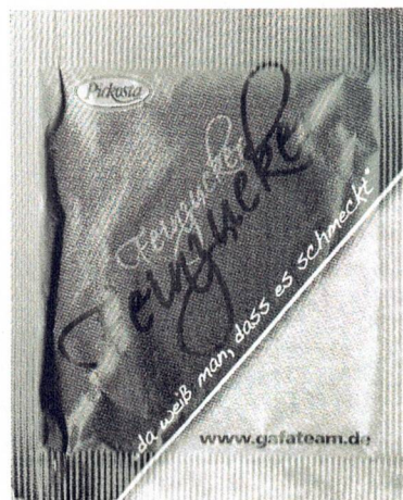
links oben dunkles grau rechts unten helles grau