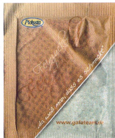
links oben mittleres braun rechts unten helles grau